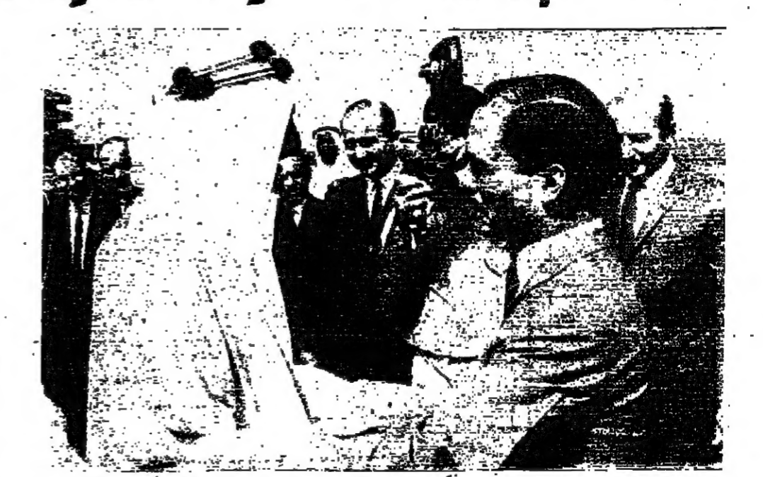
جلالة الملك فيصل يودع جلالة الملك الحسين لدى مغادرة جلالة الملكة العربية السعودية الى القاهرة صباح أمس

القاهرة - (الدستور) - و.أ. - رويتر - د.ب.أ - بدأت المحادثات الرسمية بين جلالة الملك الحسين العظيم والرئيس جمال عبد الناصر في القصر الجمهوري بالقاهرة الساعة السادسة من مساء أمس وانتهى الاجتماع الساعة السابعة والتصف . مواضيع البحث وعلم انه تمت خلال هذا الاجتماع مشاورات وتبادل وجهات النظر حول الموقف العربي الراهن وأهمية الصمود العربي أمام العدوان الإسرائيلي . كما تناولت المحادثات الموقف العربي الموحد الدولي والموقف العسكري والموقف السياسي والعلاقات الثنائية بين البلدين ونقلت وكالة الأنباء الالمانية الغربية عن مصادر عربية في القاهرة قولها ان محادثات الحسين وعبد الناصر ذات أهمية خاصة لأنها تتركز حول قضية الجبهة الشرقية على طول خط المواجهة القبية على الصفحة الرابعة عمود ٢